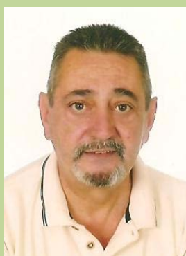
Jesús García (Redactor)