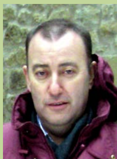
Miguel de Pablo (Redactor)