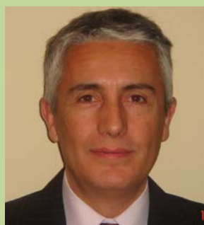
Luis Molano (Redactor)