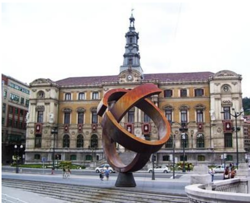
Ayuntamiento de Bilbao